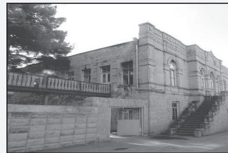
Ə.Haqverdiyevin işlədiyi Borçalı qəza idarəsi (Şulaver kəndi)

Biz parlamentə daxil olanda və öz bəyanatımızda bildirdik ki, Gürcüstan müsəlmanları öz vətənlərini, düşmənin kim olmasından asılı olmayaraq, hər kəsdən bütün mümkün vasitələrlə qoruyacaqlar və indi də, sözdən əmələ keçmək lazım olan bir vaxtda da bu bəyanatı tənənəli şəkildə təkrar edirik (alqışlar). XVIII əsrin sonlarında mərhəmətsiz Ağa Məhəmməd xanın qoşunları Şuşa qalasını mühasirəyə