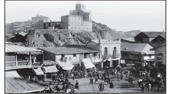
Tatar meydanı (Şeytanbazar)

Lakin bizim diqqətimiz Tiflisi müəyyən edən hissəsinə doğru yönəlib. Ərazi: Tatar meydanı, Kldisubani (Qaya məhəlləsi), Abanaant dərəsi, Əncirlər dərəsi (Nəbatat bağı), İsanı boğazı, kiçik və böyük siraxananın həndəvərləri, Metexinin hər iki körpüsünün hüdudları - Kürün qıjovundan baqqalxanaya qədər və hamamların